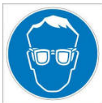
Jól záró védőszemüveg

Jól záródó védőszemüveg az EN 166 szabványnak megfelelő.